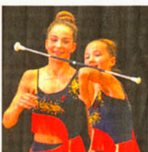
Die Athletinnen vom Baton Twirling-Sport-Club Zimmern